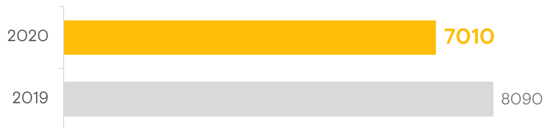
Количество закупок Ростелеком